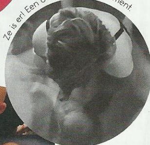
Ze is er! Een overweldigend moment.

Draai je VIVA Mama om en lees Marcells verhaal in het Papa-deel op pagina 16.